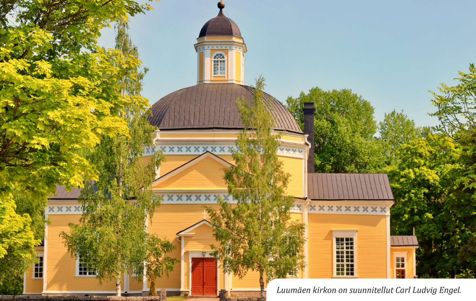
Luumäen kirkon on suunnitellut Carl Ludvig Engel.