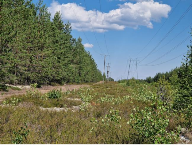
Kuva 1. Osa-alueen läpi kulkeva suurjännitelinja huoltototeineen. Kuvaussuunta itään.