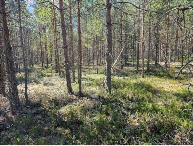
Kuva 13. Palanutkankaan länsiosan männikköä (VT/CT). Kuvaussuunta länteen.