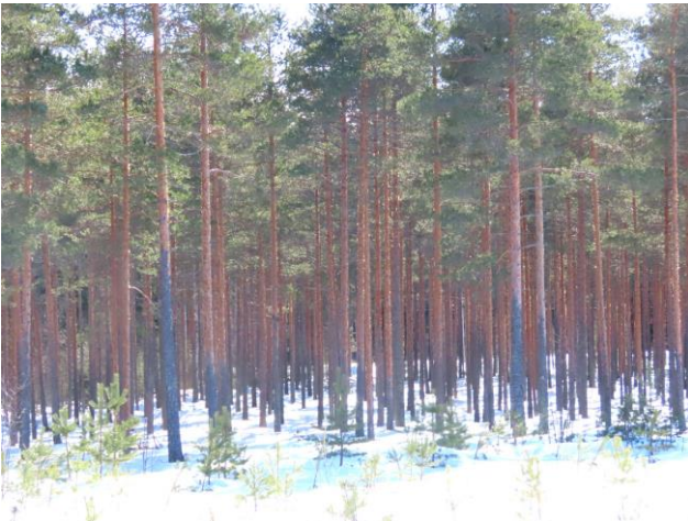
Kuva 5. Osa-alueen nuoret mäntymetsät eivät sovellu liito-oravalle. Kuva kaakkoisreunasta.

Vanhan valtatie eteläpuolen osa-alueella ei todettu vaarantuneita tai uhanalaisia lintulajeja tai uhanalaisille lajeille (direktiivin IV(a) lajit) soveltuvia elinympäristöjä, jotka olisi erityisesti huomioitava maankäytön suunnittelussa. Osa-alueen läpi kulkevan sähkölinjan alla todettiin kangasvuokkoa. Lajia todettiin myös osa-alueen etelään viettävän distaalirinteen kangasmetsässä (Kuva 5.) (LIITTEET, Kartta 3.). Kangasvuokkojen esiintymäpaikoilla ei tulisi suorittaa sellaisia toimenpiteitä, jotka uhkaavat lajin yksilöiden olemassaoloa (esim. maaperän muokkaus, tieurien rakentaminen tai hakkuujätteiden kasaaminen esiintymäpaikoille). Kangasvuokot hyötyvät avoimesta aurinkoisesta ympäristöstä, jonka vuoksi puunkorjuulle ei ole rajoituksia esiintymäpaikoilla, kunhan huolehditaan, ettei esiintymien yli ajeta eikä esiintymien päälle kasata hakkuujätettä.