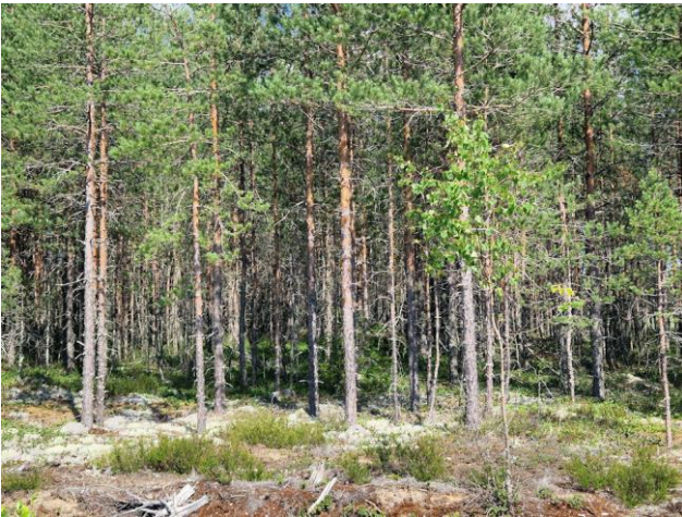
Kuva 15. Osa-alueen itäosan ensiharvennus vaiheen männikköä (VT/CIT). Kuva pohjoiseen.