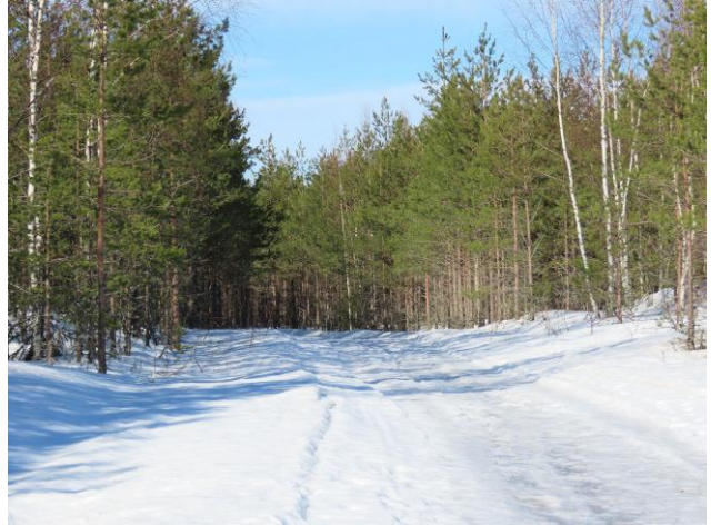
Kuva 8. Nuorta VT/CT-männikköä Kärmeniemen johtavan tien varressa.