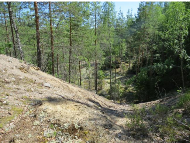
Kuva 11. Suunnittelualueen koilliskulman vanha metsittyvä sorakuoppa. Kuvattu pohjoisreunalta.