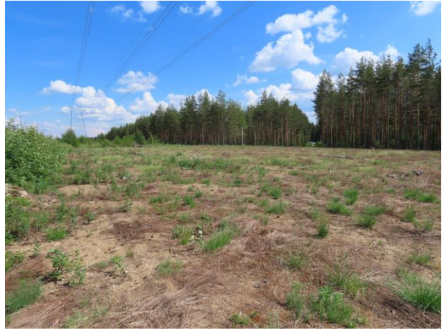
Kuva 2. Sähkölinjan alueen joutomaata, josta alkuperäinen kasvisto on kuorittu pois.