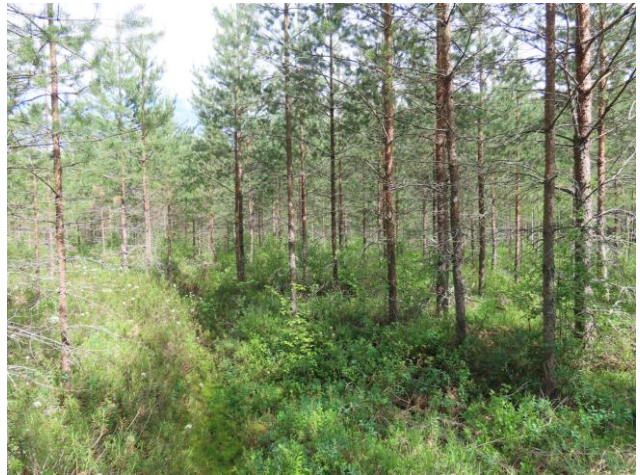
Kuva 4. Kaakkoispuolella reunamoreeni rajautuu ojitettuun rämeeseen. Kuvaussuunta itään.