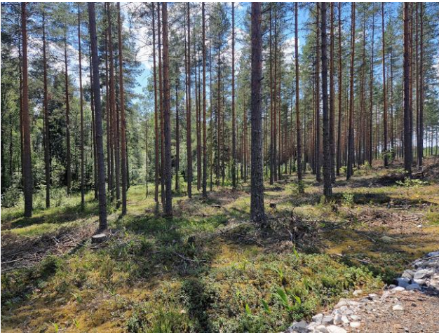
Kuva 3. Osa-alueen distaalirinteen (kaakkoisrinne) VT-männikköä. Kuvaussuunta länteen.