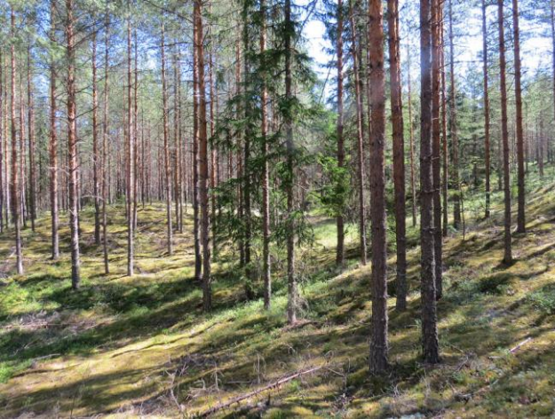
Kuva 7. Reunamuodostuman proksimaalirinteen (pohjoisrinne) laakeaa suppa-alueita. Kuvattu itään.