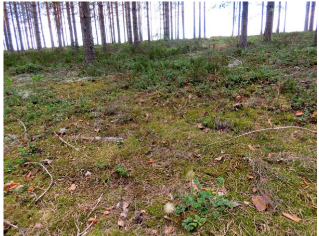
Kuva 6. Kangasvuokkoa (kuvassa etualalla) todettiin distaalirinteen VT-männikössä sekä sähkölinjan alta.