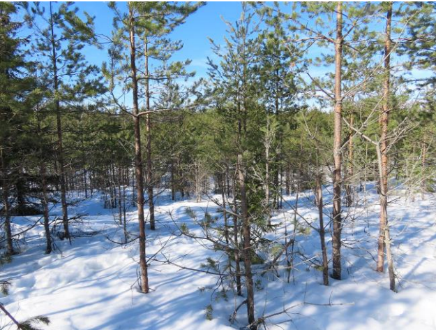
Kuva 9. Lakialueen nuorta VT/CT-männikköä. Kuvaussuunta kaakkoon.