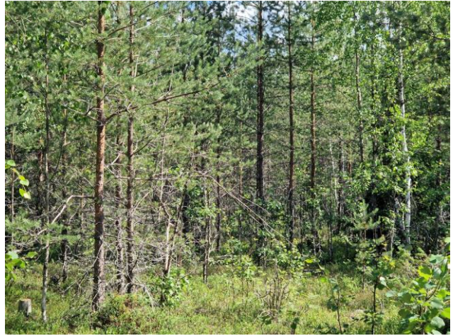
Kuva 14. Uudenvaltatien lähellä nuoret metsät ovat kapealta kaistalta VT/MT-kangasta.