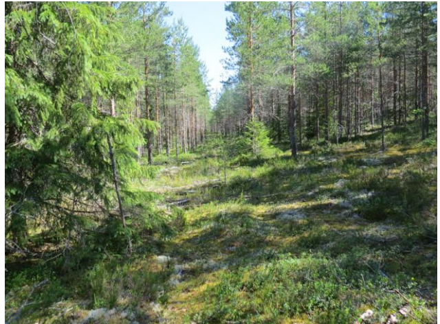
Kuva 10. Nuorta mäntymetsää (VT/MT) osa-alueen proksimaalirinteessä (pohjoisrinne). Kuvattu itään.