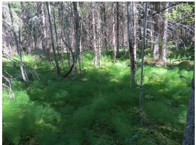
Kuva 12. Suunnittelualue rajautuu koillisessa ojitettuun korpeen.