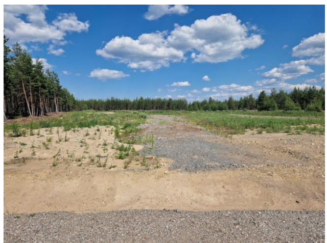
Kuva 18. Vanhan valtatie varren laaja joutomaa-alue itään päin kuvattuna.