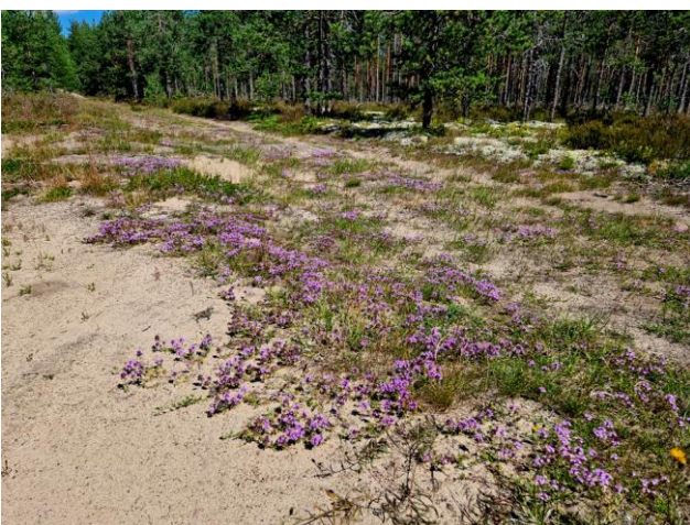
Kuva 17. Palanutkankaan itäosan kangasajuruohon esiintymää. Kuva pohjoiseen.