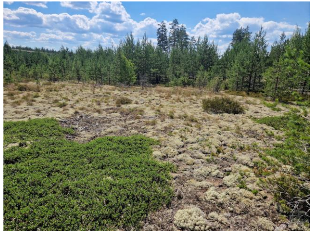
Kuva 16. Osa-alueen itäosan CIT-taimikkoa. Kuvaussuunta pohjoiseen.